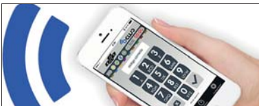
CONEXIÓN MEDIANTE SMARTPHONE SMARTPHONE CONNECTION CONNEXION PAR SMARTPHONE