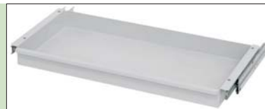
CAJÓN EXTENSIBLE EXTENDABLE DRAWER TIROIR EXTENSIBLE