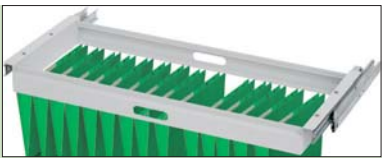
ARCHIVADOR EXTENSIBLE SLIDING FILE HOLDER CLASSEUR EXTENSIBLE