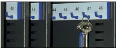
PANEL CLASIFICADOR DE LLAVES KEY RACK WITH ID SYSTEM PANNEAU DE RANGEMENT POUR CLÉS