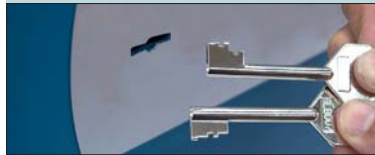
KIT CERRADURA DOBLE INTERVENCIÓN "L" TWO KEYS CONTROL KIT "L" KIT SERRURE À DOUBLE INTERVENTION "L"