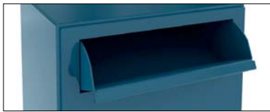
CAJÓN BASCULANTE SWIVELLING DRAWER TRAPPE BASCULANTE