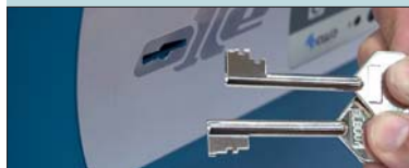
KIT CERRADURA DOBLE INTERVENCIÓN "E" TWO KEYS CONTROL KIT "E" KIT SERRURE À DOUBLE INTERVENTION "E"