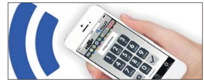
CONEXIÓN MEDIANTE SMARTPHONE SMARTPHONE CONNECTION CONNEXION PAR SMARTPHONE

La série DEP permet déposer de l'argent et des objets volumineux dans son intérieur sans besoin d'ouvrir la porte. Grâce à son trappe basculante doté du système anti-pêche. Également disponible avec la technologie oCLOW.