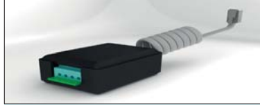
KIT INTERFACE ALARMA ALARM INTERFACE KIT KIT INTERFACE ALARME