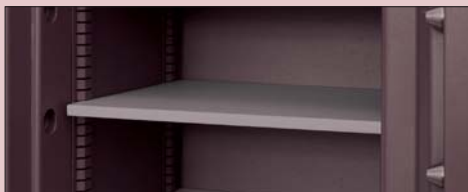
ESTANTERÍA SHELF ÉTAGÈRE