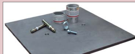
KIT ANCLAJE ANCHOR KIT KIT DE FIXATION