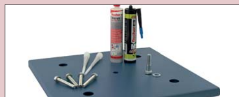
KIT PASTILLA DE ANCLAJE ANCHORAGE SHEET KIT KIT PLAQUE D'ANCRAGE

Configuraciones y precios en la página 77 Configurations and prices on page 77 Configurations et prix à la page 77