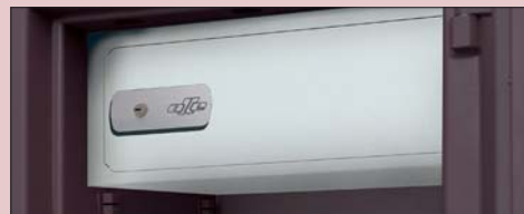
SECRETER INNER COMPARTMENT SECRÉTAIRE