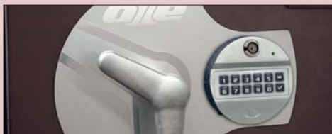
KIT LLAVE DALLAS DALLAS KEY KIT KIT CLÉ DALLAS