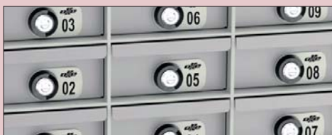
CAJONES PARA SERIE III / IV DRAWERS FOR SERIES III / IV TIROIRS POUR SERIES III / IV

Configuraciones y precios en la página 77 Configurations and prices on page 77 Configurations et prix à la page 77